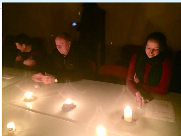
Un Conseil Municipal inédit pour les trois nouveaux conseillers élus