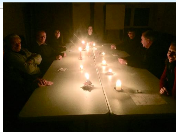
Non, il ne s'agit pas d'une secte en réunion, mais du Conseil Municipal qui s'adapte aux circonstances !...